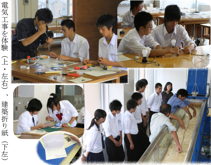
電気工事を体験(上・左右)、建築折り紙(下左)

この体験入学に参加した中学生の何人が、来年本校に入学するのか、今から楽しみにしている。