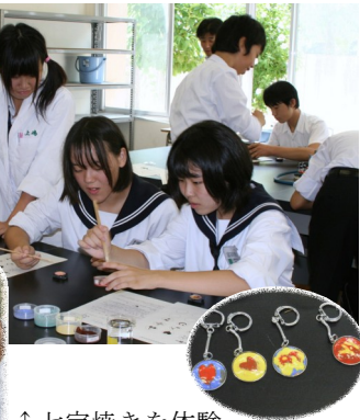
↑ 七宝焼きを体験 ← 染色に挑戦 体験中の中学生