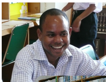
↑ 1分30秒に答える新ALT・ボイス先生