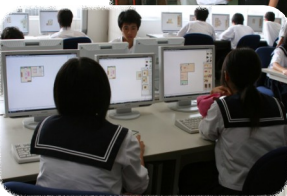
↑ 溶接の様子に釘付け 建築のデザイン中 ↑ 水理の実験に参加(下)